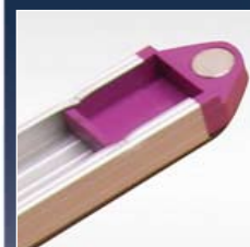
Selbstschließende magnetische Aufhänger